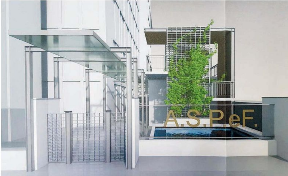
Il rendering del nuovo ingresso dell'Aspef

MANTOVA Oltre alla riqualificazione dell'ingresso di Piazzale Michelangelo con i tre mini appartamenti, l'Aspef sta vagliando anche nuove idee, per migliorare i servizi. Uno di questi è quello delle farmacie. Tra queste, la farmacia Gramsci e la Due Pini. Per entrambe ci saranno delle novità importanti. Da giugno infatti partiranno i lavori di riqualificazione della farmacia di viale Pompilio, mentre in Piazza Gramsci, dove attualmente si trova il veterinario, l'intenzione sarebbe quella di attivare un InfoPoint di Aspef, che attualmente non esiste, o meglio esiste parzialmente negli uffici, troppo stretti, seppur appena rimodernizzati, nella sede di Piazzale Michelangelo.